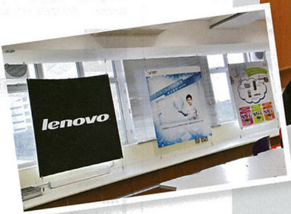
● 鳳溪創新小學，展示出以往各個合作的商戶，各商戶都為校提供不同的科技幫助。